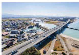
現在の手取川橋 (2022年撮影)

「手取川橋」は、1972年の開通から50年が経過しました。これまで補修工事や耐震補強工事をおこなってきましたが、塩害などの影響を受けて老朽化が進行しています。「新手取川橋リニューアルプロジェクト」は、塩害により劣化した橋げたも全て取り替える大規模な工事です。このプロジェクトにより、耐久性の高い「新手取川橋」へと生まれ変わります。