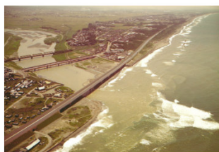
開通当時の手取川橋 (1976年撮影)